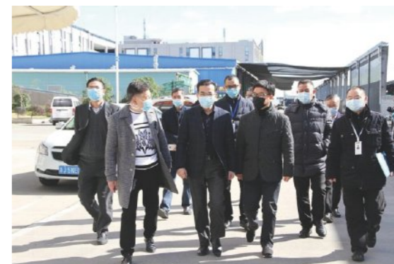
台州市副市长蒋冰风赴农港城调研，集团党委副书记陈兴忠陪同调研

谋划环保全产业链，以行业龙头来定位自身，充分发挥国有企业平台优势，不断夯实环保产业链基石，推进集团环保产业发展。